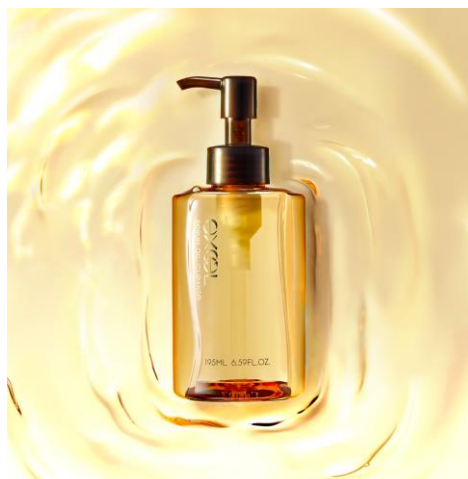
サナ エクセル セラムオイルクレンジング 195mL 1,800円(税抜)

「エクセル セラムオイルクレンジング」は、心地よさにこだわった美容液発想のクレンジングオイルです。厚みのあるクッションオイルで摩擦を軽減し、こすらずに撫でるだけでメイクを速やかにオフ。贅沢7種の植物オイル(アルガンオイル*1、ホホバ種子油、ブドウ種子油、スクワラン、メドウフォーム油、オリーブ果実油、マカデミア種子油 ※すべて保湿)を配合し、やさしくお肌を包み込みます。また精油を配合したベルガモット&ユーカリの香り。至福の香りに包まれ、リラックスしたクレンジングタイムをお届けします。ダブル洗顔不要。濡れた手で使える。まつ毛エクステンションもOK*2。