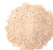
肌なじみの良い クリアタイプ