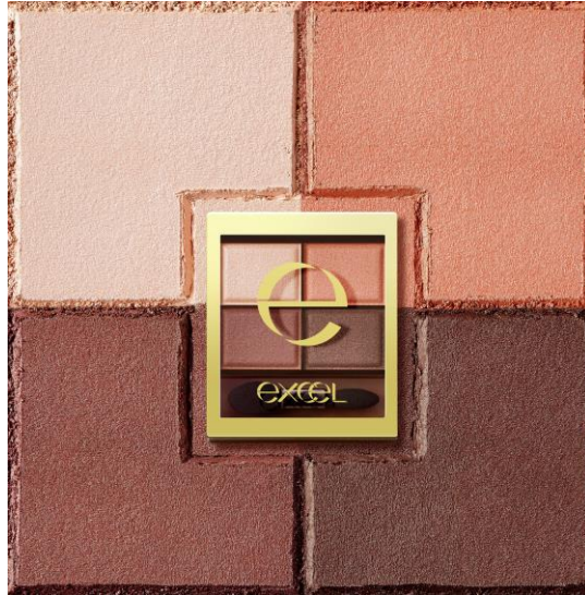
サナ エクセル スキニーリッチシャドウ SR11(ブリックブラウン) 1,500円(税抜)

このたび発売となる待望の新色は、繊細なパールをたっぷり配合した赤みのあるブラウンパレット。やわらかな血色感ブラウンで温かみのある目元に仕上げます。