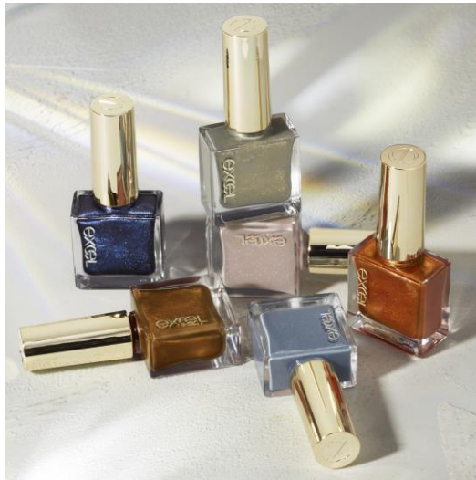
サナ エクセル ネイルポリッシュ N NL20~25(全6色) 各10mL 1,000円(税抜)

※「NL25 スターリーナイト」は、オンライン限定(エクセル公式オンラインストア及び amazon、ロハコ、@cosme ショッピング等)での取り扱いとなります。