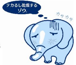
「2009年 化粧品に関する調査」N=356マクロミル調べ 「2009年 化粧品に関する調査」N=356マクロミル調べ