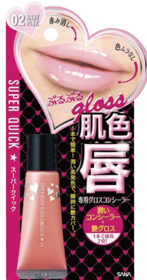
スーパークイック グロスコンシーラー EX 02 (ベビーピンク) 950円 (税込 997円)