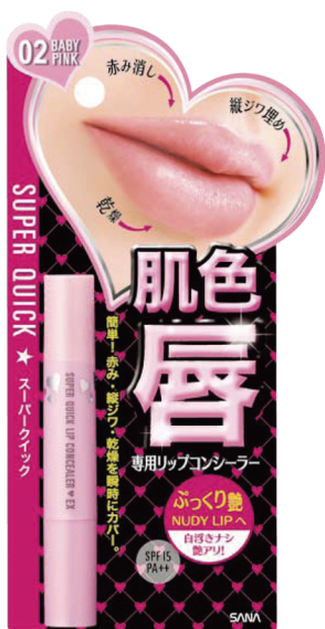
スーパークイック リップコンシーラー EX 02 (ベビーピンク) 850円 (税込 892円)