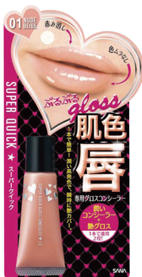
スーパークイック グロスコンシーラー EX 01 (ヌードベージュ) 950円 (税込 997円)