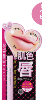
スーパークイック リップコンシーラーEX 02