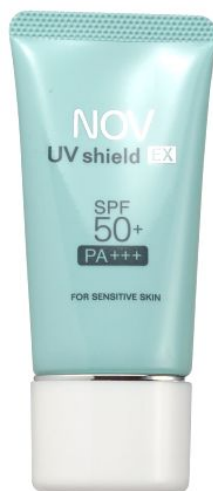
ノブ UVシールドEX 30g 2,625円（税込）