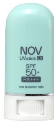
ノブ UVスティックEX 3,150円（税込）