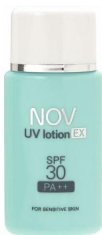
ノブ UVローションEX 35mL 2,100円（税込）

敏感肌はバリア機能が低下しているため、紫外線を浴びると、赤み・かゆみ・ひりひり・肌あれなどの日やけによる肌ダメージを受けやすい状態です。この肌ダメージを受けやすい敏感肌に、もっとも適した日やけ止めの登場です。やさしい処方設計にこだわり、同時にSPF・PA値の強化を行い、敏感な肌を紫外線から守ります。